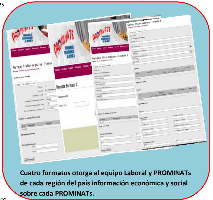
Cuatro formatos otorga al equipo Laboral y PROMINATs de cada región del país información económica y social sobre cada PROMINATs.

La información recabada será almacenada y administrada desde los años 2009, 2010 y 2011, precisando información sobre: capacitación a colaboradores, reportes e historiales de los NNATs, fechas y montos de pago con un registro automático, movimiento económico, etc.