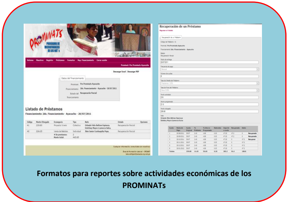
Formatos para reportes sobre actividades económicas de los PROMINATs

Los facilitadores del proyecto están capacitando para el acceso y uso del sistema en los diferentes PROMINATs, por lo que el hecho ha llamado la atención positivamente a todos los involucrados del programa; tanto