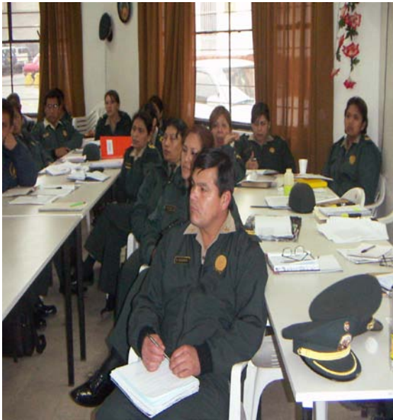
Curso “Violencia Social y política en el Perú” dirigido a la PNP.